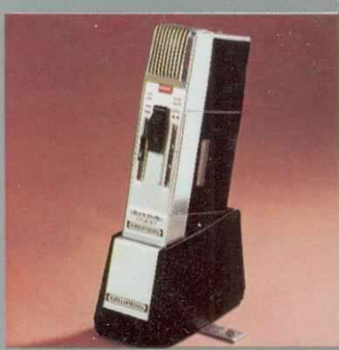
Stenorette 2000 mit Netzteil